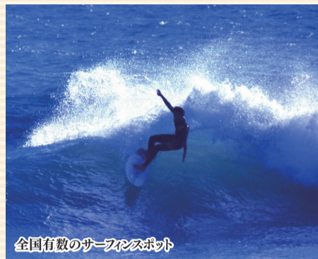
全国有数のサーフスポット